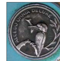
Esploso dell'Alcedo Omnia De Luxe. In basso: particolare dell'interno dell'Alcedo Omnia Minor.